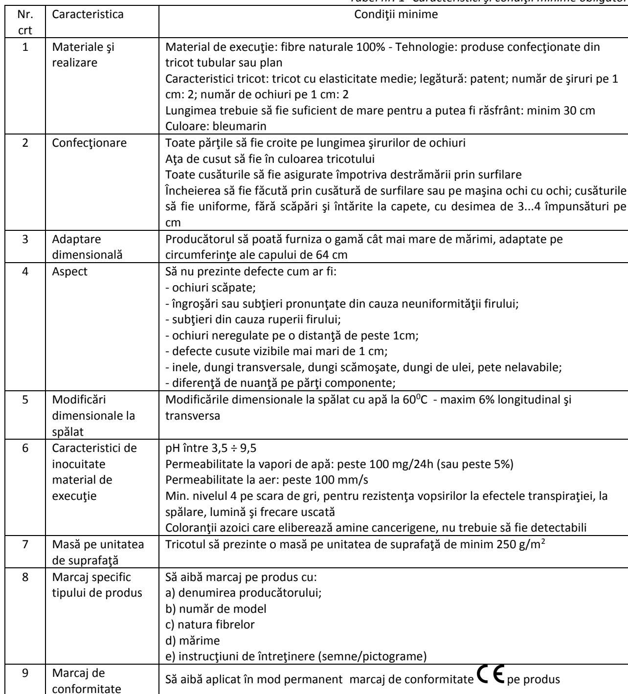
Tabel nr. 1- Caracteristici și condiții minime obligatorii

Nivelul stabilit de SSH HIDROSERV SA este minim obligatoriu. Dacă ofertantul declară și dovedește prin documente că modelul prezentat are un nivel de performanță superior celui specificat în Tabelul nr. 1, acest lucru poate fi factor favorizant la stabilirea punctajului tehnic, iar un nivel inferior este factor defavorizant (de respingere). Tabelul nr. 1 include și caracteristici care sunt definite ca opțiuni posibile, soluția adoptată depinzând de producător și putând fi element de departajare la stabilirea punctajului tehnic specific.